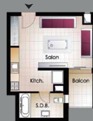
S+0 A partir de 42 m 2 - 47 m 2