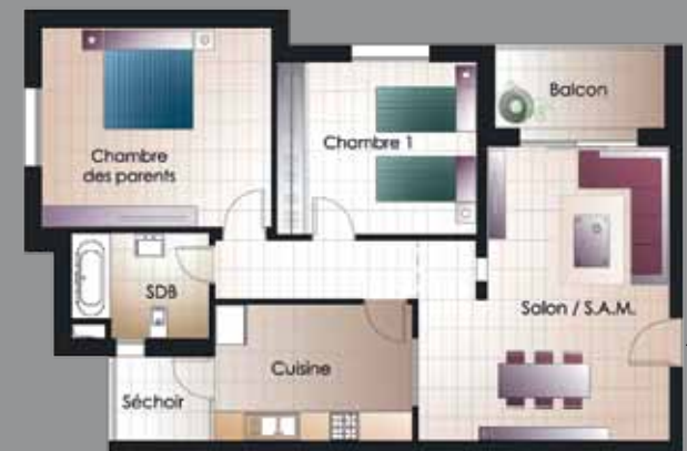
S+2 A partir de 103 m 2 - 126 m 2