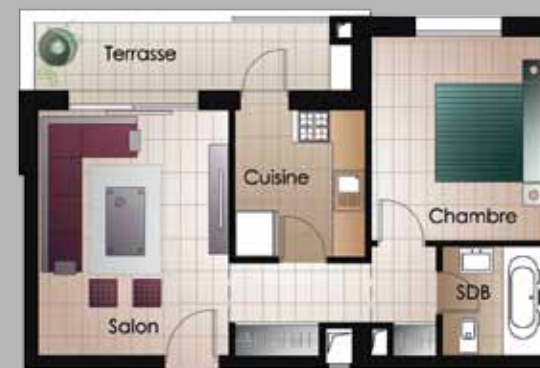
S+1 A partir de 64 m 2 - 89 m 2